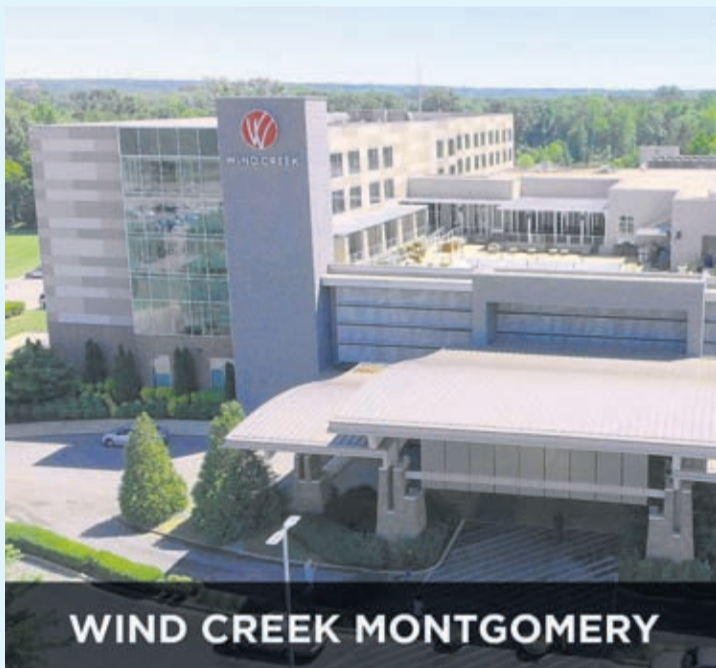
WIND CREEK MONTGOMERY